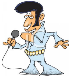
de zanger le chanteur