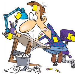
de tekenaar le dessinateur