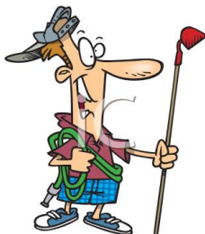
de tuinman le jardinier