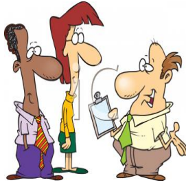
de tolk l'interprète