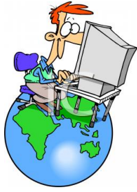
de vertaler le traducteur