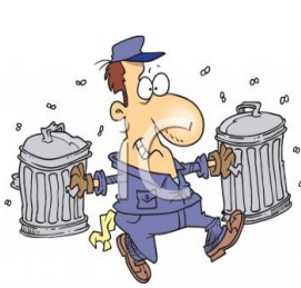
de vuilnisophaler l'éboueur