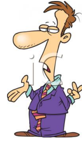
de politicus le politicien