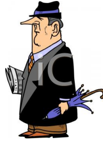
de notaris le notaire