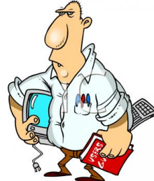
de informaticus l'informaticien