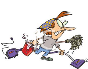
de poetsvrouw la femme de ménage