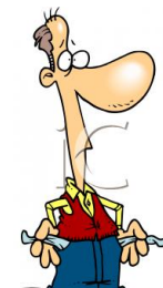
de werkloze le chômeur