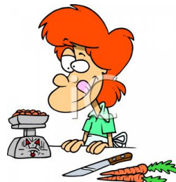
de huisvrouw la mère au foyer