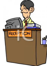
de receptionist le réceptionniste