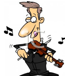
de muzikant le musicien