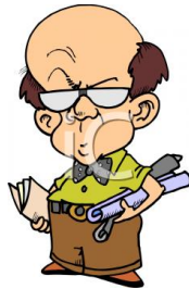
de ingenieur l'ingénieur